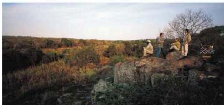
Amanecer en Sabi Sabi. El primer safari fotográfico se organiza al alba y a veces incluye un café en lugares seguros.

ría, por lo que conviene consultar en los centros de medicina internacional sobre la necesidad de medicación preventiva.