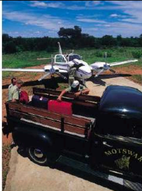
Existe la posibilidad de combinar el transporte hasta el parque con la realización de safaris aéreos gracias a compañías como Naturelink.

El Parque puede ser recorrido y visitado con la ayuda de los mapas que se adquieren en las entradas y las facilidades que aportan los refugios, miradores y alojamientos distribuidos en su interior. Las normas de visita exigen que los vehículos no abandonen las carreteras de tierra trazadas, que los viajeros no dejen sus coches solo en las zonas acondicionadas para