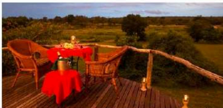
El Parque Kruger acoge 450 especies de pájaros y 138 de mamíferos. Los elefantes superan la cifra de 8.000.

del parque, en las áreas conocidas como Timbavati, Klaserie, Thornybush, Manyeleti, Mala Mala, Sabi Sabi y Sabi Sand. No hay barreras artificiales entre las reservas y el Parque, por lo que se puede decir que todas estas superficies de uso privado pertenecen al ecosistema del mismo parque. La entrada principal al parque –y a las reservas– se encuentra junto al aeropuerto de Sincuzua, a una hora de vuelo del de Johannesburgo.