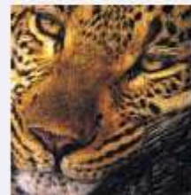
El más huidizo de los "big five".

A no muchos kilómetros de la entrada principal del Kruger se encuentra el pueblo minero de Pilgrim's Rest y las cascadas y miradores de Blyde River Canyon, la Ventana de Dios y el Fin del Mundo.