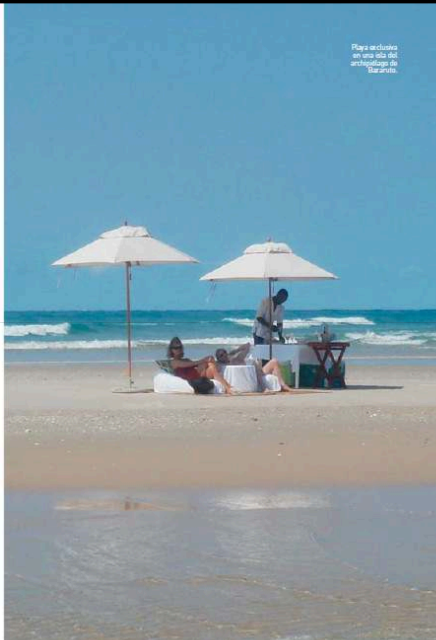
Playa exclusiva en una isla del archipiélago de Bazaruto.

Algunas islas también poseen riqueza cultural. Es el caso de la isla de Ibo, que entre los siglos XVI al XIX acogió mercados de marfil, oro y esclavos, y mantiene vestigios coloniales portugueses. En el interior, los parques de Niassa y Gorongosa y el lago Niassa ofrecen la mayor concentración de fauna salvaje del país. Gorongosa es, además, un destino clave para los birdwatchers , los observadores de pájaros. Cuatrocientas especies de aves anidan en esta reserva natural. Nelson Mandela impulsó la unión del parque Kruger con los parques del suroeste de Mozambique y del sureste de Zimbabwe para crear el mayor corredor de fauna salvaje de África. ☺